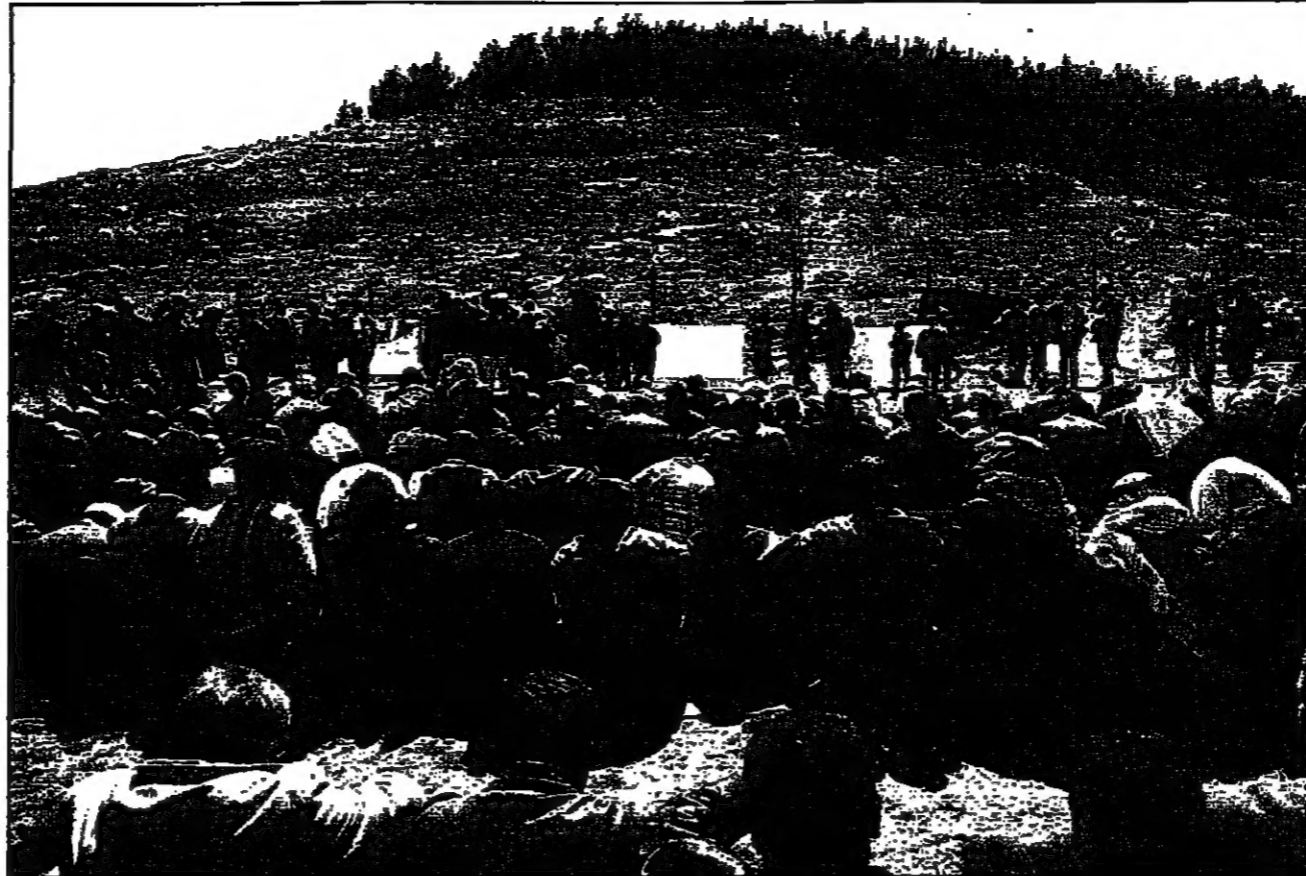
فلسطينيون يؤمنون صلاة الجمعة على جبل أبو غنيم التي أصدرت إسرائيل قرارا ببناء مستوطنة يهودية عليه (رويت)

رام الله - القدس العربي: من ماجد عبد الهادي: القدس - من سامي العابدوني: